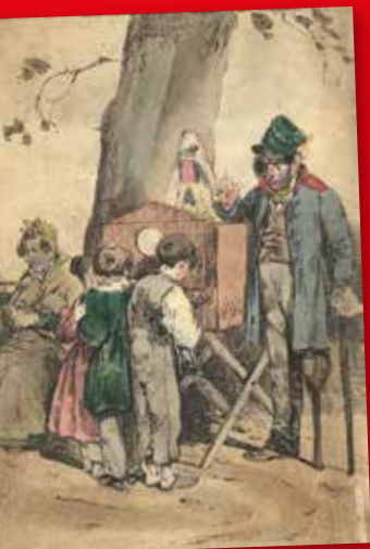
Perspektivtheater von Martin Engelbrecht, "Präsentation eines Erdbebens", 2. Hälfte des 18. Jahrhunderts

Die Veranstaltungsreihe "Thema des Monats" hebt Schätze und Kuriositäten aus dem Depot und aus privaten Sammlungen ans Licht der Öffentlichkeit. Die Veranstaltungsreihe greift aber auch Themen aus Kunst und Geschichte auf, die einen Bezug zur Gegenwart haben und eine kundige Betrachtung wert sind.